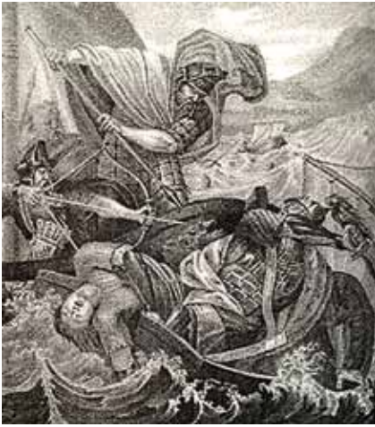
▲ Кончина Святослава. Б. А. Чориков, «Живописный Карамзин, или Русская история в картинках», 1836 г.

может помиловать род мой и всех людей русских; и как захочет, обратит сердца их к разумению благочестия и во время благопотребно сподобит просвещения и совершенной веры».