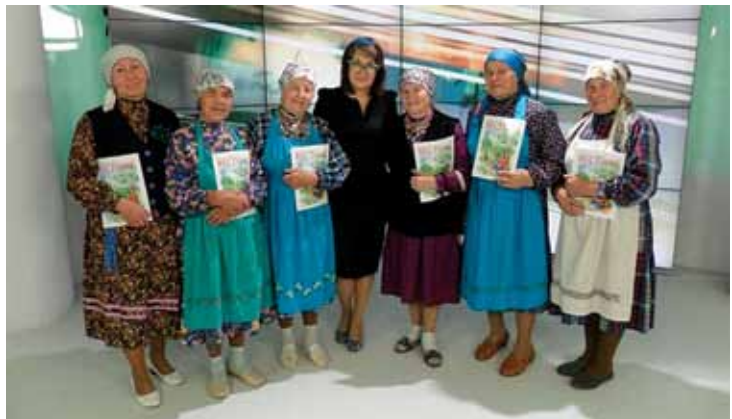
▲ «Православный вестник» в подарок!