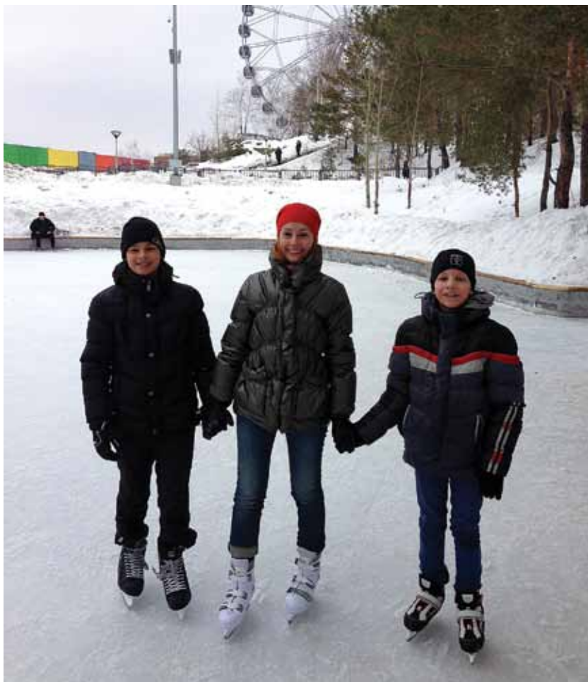
С ребятами на катке, февраль 2014 года

— Я думаю, готовым надо быть к тому, чтобы не ждать даже какой-то отзывчивости или благодарности за то, что ты делаешь,