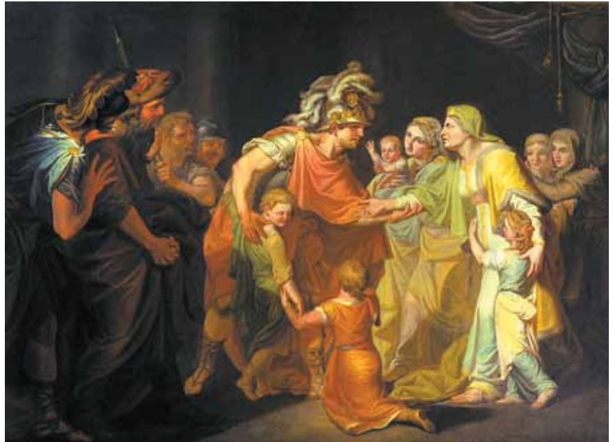
И. А. Акимов. Великий князь Святослав, целующий мать и детей своих по возвращении с Дуная в Киев. 1773

Следует отметить, что сказание о святой княгине Ольге, дошедшее до нас в летописных сводах, объединяет в себе сведения из нескольких источников. Самые ранние из них, повествующие о мести Ольги древлянам за смерть своего мужа, вероятно, были оставлены летописцем-язычником, писавшем ещё при князе Игоре. Другие сведения, в том числе о беседах матери с сыном по поводу принятия христианства, были включены летописцами-христианами по прошествии многих лет после обретения нетленных мощей Ольги. Разумеется, вложенные в уста княгини слова не стоит принимать буквально, но в них отразилась важность для древнерусских книжников XI-XII веков темы материнского страдания за детей, не желающих идти истинным путем, а также совершенно очевидный образ любимого, но непослушного сына как аллегория всего русского народа. В этом рассказе летописец рисует Ольгу духовной матерью своего народа, болеющую сердцем за то, чтобы привести его к Христовой вере. Та же летопись продолжает: «Однако, Ольга любила своего сына Святослава и говаривала: «Да будет воля Божия; если захочет Бог помиловать род мой и Землю Русскую, то вложит им в сердце то же желание обратиться к Богу, что даровал и мне». И, говоря так, молилась за сына и за людей всякую ночь и день, воспитывая сына до его возмужалости и до его совершеннолетия».