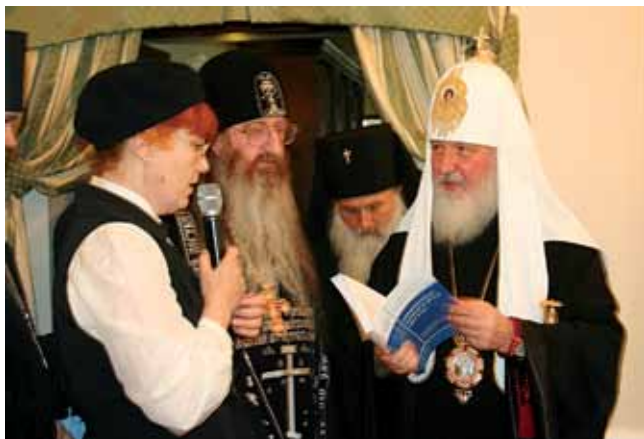
Благословение Святейшего Патриарха Кирилла на создание Миссионерского института. Екатеринбург, 2010 год

Получилось так, что чуть позже меня пригласили преподавать риторику на Миссионерские курсы, которые действовали сначала при мужском монастыре во имя Всемилостивого Спаса, а потом при Ново-Тихвинском монастыре. В течение нескольких лет я преподавала на курсах, мне это