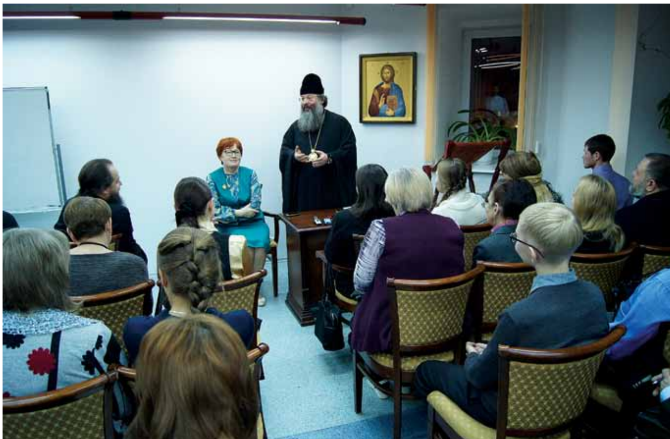
Владыка Кирилл благословил студентов Миссионерского института на начало учебного года

сегодня — это передний край работы Церкви, что от православных миссионеров во многом зависит судьба страны. А ещё раньше, когда несколько лет тому назад Святейший был в Ново-Тихвинском монастыре и посетил наши Миссионерские курсы, он благословил нас на создание института и сказал о том, что задача миссионеров (я запомнила дословно) «воцерковлять наших расцерковленных соотечественников».