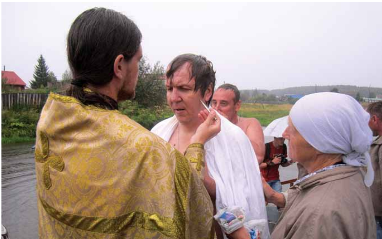
Крещение на реке Чусовой