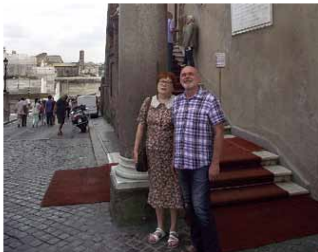
Поездка с супругом в Рим