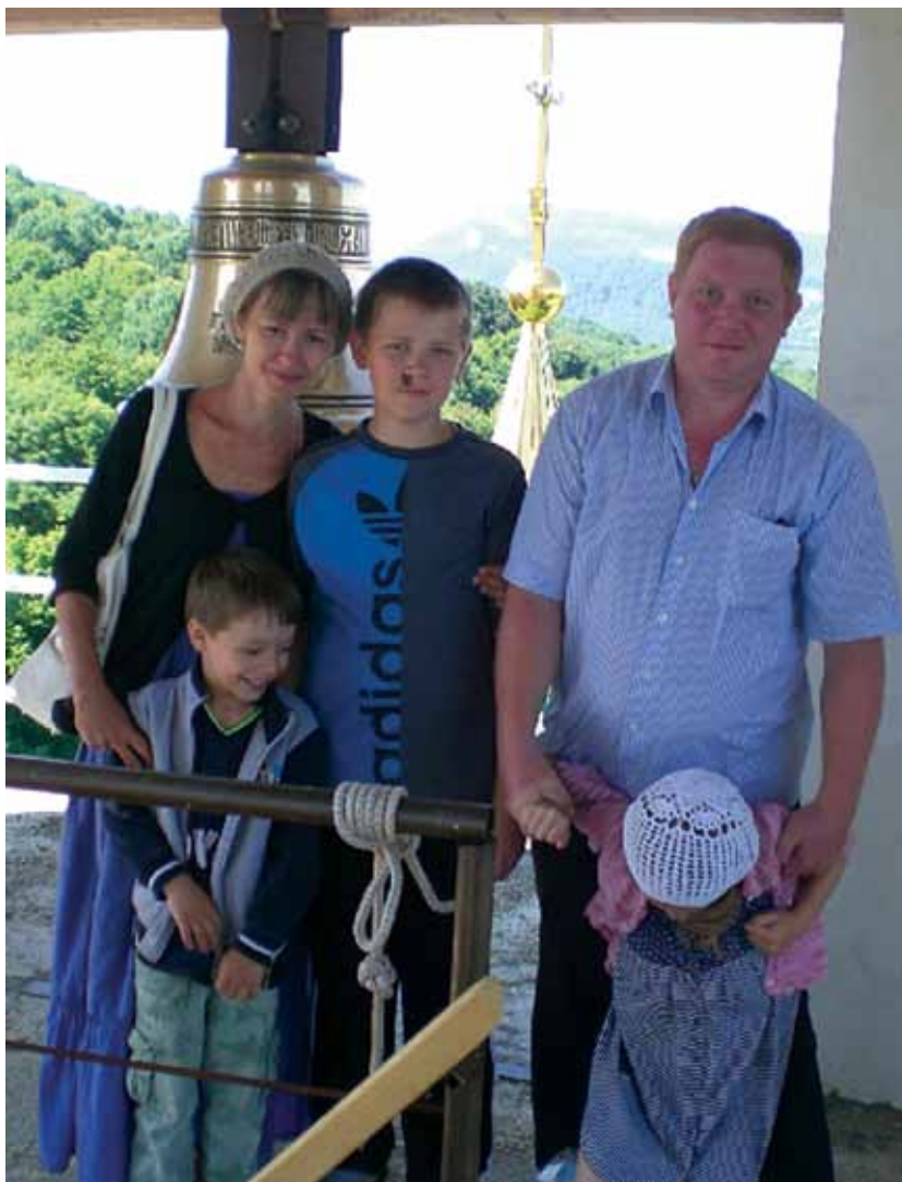
Паломничество в Свято-Михайловско-Афонскую Закубанскую пустынь (Адыгея)