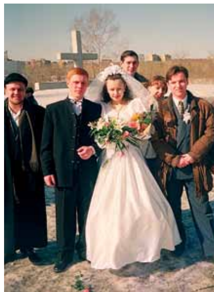
Свадьба: у Поклонного Креста на месте будущего Храма-на-Крови

при храме уже существовали огласительные беседы. Пусть их было немного, всего четыре, но на них меня озадачили важными вопросами: для чего вы хотите крестить ребенка, для чего существует Церковь? Поначалу я отправлялась на эти беседы с желанием их «высидеть», но потом любопытство победило. Нам рассказали о смысле жизни и о таинствах — знания, которые нам успели передать за четыре беседы, уже не давали жить постарому. Я начала воцерковляться, много читала и предлагала мужу понравившиеся книги, мы вместе обсуждали вопросы веры. Сначала он относился к воцерковлению несколько прохладно: «Если тебе это интересно, пожалуйста, ходи в храм». А потом сам стал приобщаться. Отвезёт, например, меня с сыном в монастырь на Ганину Яму, да и сам зайдёт на службу.