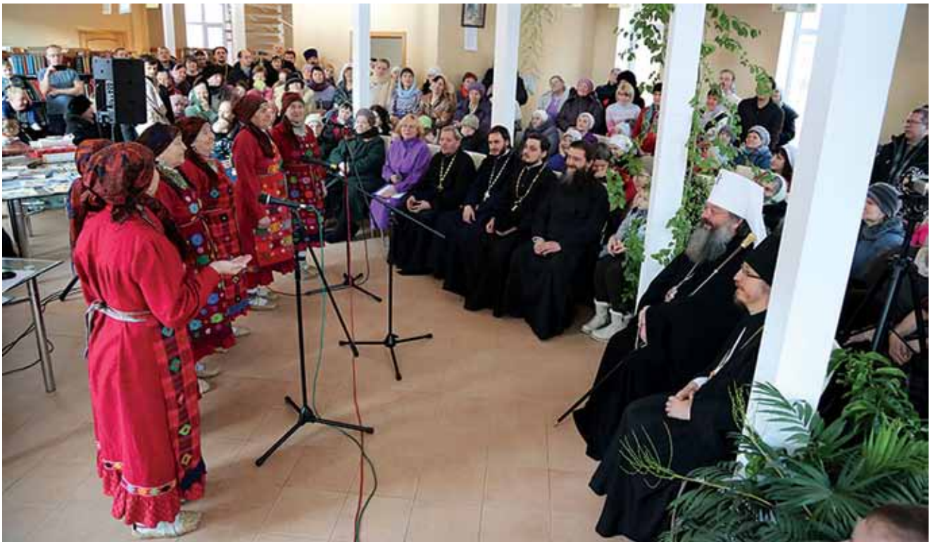
Выступление «Бабушек из Бураново» в храме святого целителя Пантелеимона, январь 2015 года

в кармане зазвенел телефон. Звонили из крупной энергетической компании: «Я слышал, что вы поете рок-песни на удмуртском языке. Не могли бы вы несколько хитов перевести и спеть? Я бы записал диски, подарил бы своим друзьям и хорошо бы вам за это заплатил». А ведь мы только подумали — построить бы храм, да денег нет!