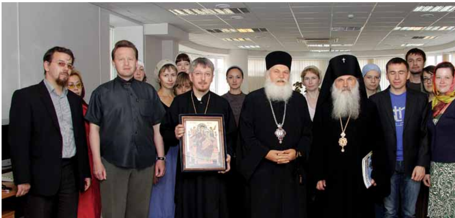
Благословение сотрудникам ТК «Союз» от отца Ефрема, игумена Ватопедского монастыря: список с иконы Божией Матери «Всецарица» (2011 год)

не проследила, не помогла), поэтому я с ним разделяю участь, «прилетающую» от вышестоящего руководства.