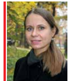
Статью подготовила Юлия Комлева, кандидат исторических наук

датой Крещения Руси считается 988 год, с которого ведёт своё начало официальная история Русской Церкви. В ней образы святых равноапостольных княгини Ольги и князя Владимира, взаимно дополняя друг друга, воплощают материнское и отеческое начало русской духовной истории.