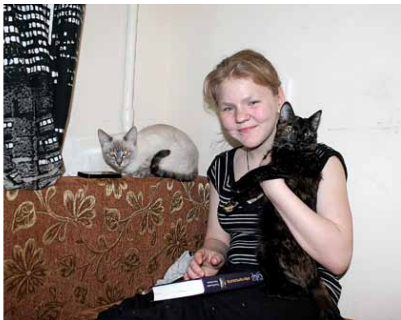
Люби хватает и на домашних животных

— Я сначала думала, что они беспомощные, пришла, начала учить борщ варить, но поняла,