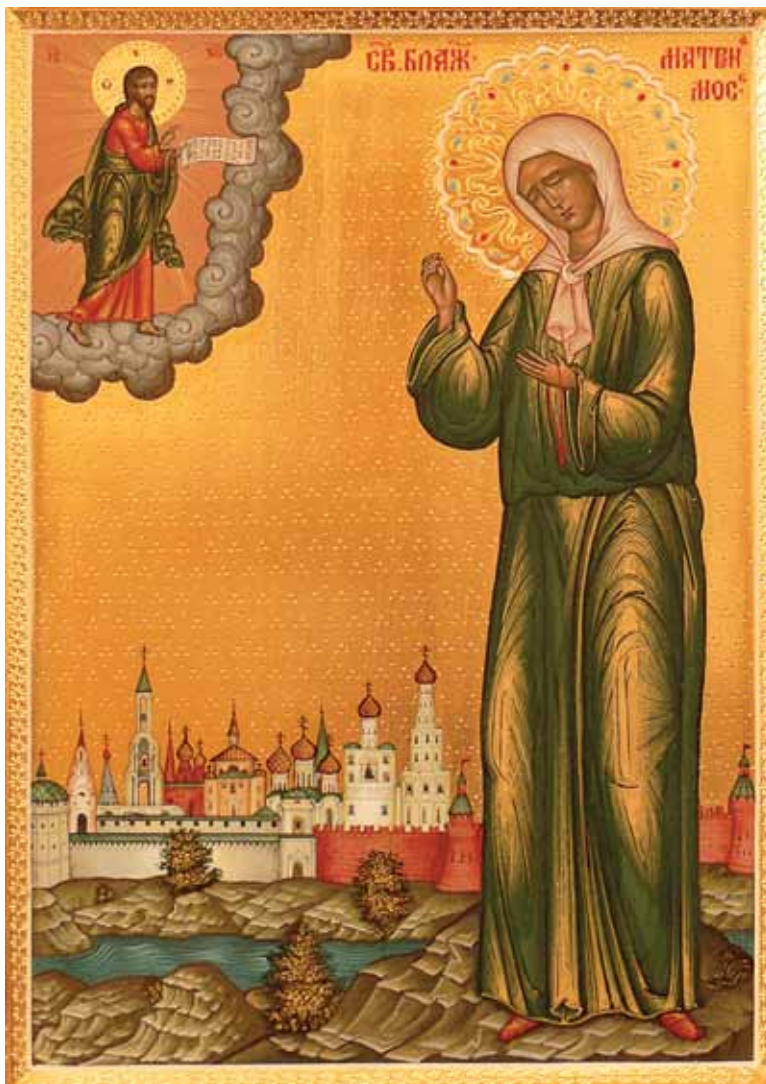
▲ Блаженная мати Матрона, моли Бога о нас!