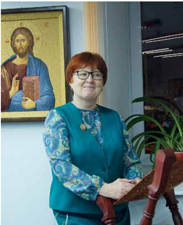
Замечательно, когда работа приносит радость